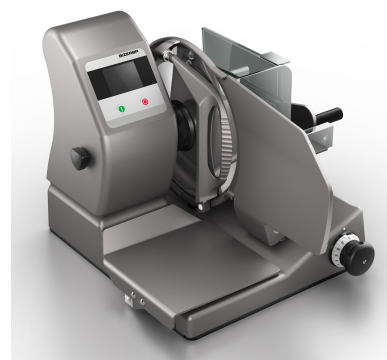
VS12 W (mit integrierter Kontrollwaage)

Die vertikale Schlitzenanordnung der VS12 sorgt für eine ergonomische, aufrechte Bedienung bei gleichzeitig optimaler Einsicht auf das Schneideergebnis. Ihr Herz besteht aus einem kraftvollen Motor - die Energie wird dort eingesetzt, wo sie Leistung bringt: am Messer. Darüber hinaus zeichnet sie sich durch einen breiten Variantenreichtum aus. Durch die nachstellbare Schneidgutabstützung wird verhindert, dass das Schneidgut am Messer nach unten ausweicht und sich "Zipfel" bilden. Highlight der manuellen Vertikalschneidemaschinen ist die integrierbare Kontrollwaage. Darüber hinaus verfügt sie über die Ceraclean® Oberfläche, die nicht nur leicht zu reinigen ist, sondern dafür sorgt, dass das Schneidgut leicht über die Schlittenplatte gleitet.