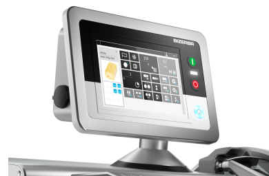
Écran tactile avec arborescence de menu personnalisable