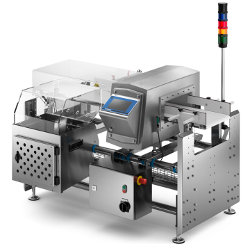
iMD pro MSF

Das System ist für den Fall von Kontaminationen entweder mit einer Stopp-on-Detect-Funktion (SOD) oder mit einem Ausscheidsystem ausgestattet. Das hygienische Design und Schutzart IP65 ermöglichen einfaches und gründliches Reinigen.