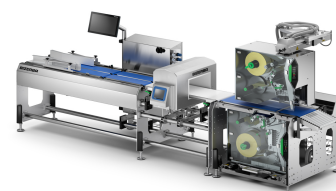
GLM-I 100 с металлодетектором