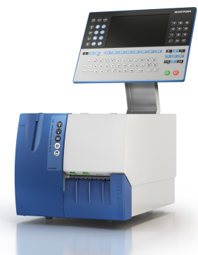
GLPmaxx 80, исполнение из окрашенной стали