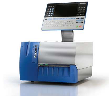
GLPmaxx в исполнении из нержавеющей стали

GLPmaxx используется для этикетирования продукции в пищевой промышленности, на небольших производствах, а также в логистике. Он идеален для печати транспортных и складских этикеток и является отличным решением в комбинации с технологией взвешивания Bizerba для тех, кто только начинает развивать тему маркировки продукции на своем предприятии. Принтеры этого модельного ряда могут подключаться в сеть и управляться напрямую через интернет. Настройка и сервисное обслуживание печатного устройства без использования инструментов позволяют сократить расходы и улучшить качество печати. Благодаря новому аппаратному обеспечению на базе ПК, этот модельный ряд не только располагает увеличенным объемом памяти, но и быстро генерирует данные для этикеток. Через USB-подключение можно легко выполнять сохранение резервной копии данных, а также данных статистики. Терминал управления GT-7C с цветным дисплеем отличается эргономичностью, благодаря чему возможность ошибок при управлении сведена к минимуму. Модель GLPmaxx linerless предназначена для работы с Linerless-этикетками без бумажной основы. Поскольку рулон таких этикеток содержит на 40% этикеток больше, чем рулон с обычными этикетками, вы экономите время на замене рулонов при одинаковом количестве упаковок.